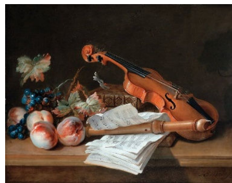
Nature morte au violon Henri-Horace Roland de la Porte