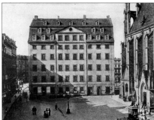
École Saint-Thomas à Leipzig