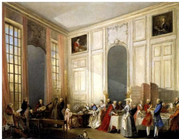
Le Thé à l'anglaise servi dans le salon des Quatre-Glaces au palais du Temple à Paris en 1764 - Michel Barthélémy OLLIVIER

C'est ainsi qu'après s'être promenée avec le comédien Malo de La Tullaye dans leur précédente Flânerie en compagnie de Diderot , Alice Julien-Laferrrière propose dans ce concert littéraire d'entrer dans l'intimité du salon du grand philosophe et écrivain à la plume si fantaisiste. Nous y rencontrerons le Diderot épistolier, qui commente pour ses contemporains la mort de Rameau et sa rencontre avec Rousseau... mais aussi le critique d'art, qui dans Les Salons rend par écrit ce qu'il voit lors des expositions organisées par l'Académie royale de peinture et de sculpture au Louvre, et se promène dans les œuvres de Boucher, Greuze, van Loo... ou encore l'ami facétieux, qui a laissé à la postérité une description emphatique du tableau de Vernet qu'il possède dans son modeste logement, pour le plus grand plaisir du lecteur. Ses écrits sur la musique feront le lien avec les œuvres de Rousseau, Rameau et Corrette, interprétées par les trois musiciennes de l'Ensemble Artifices.